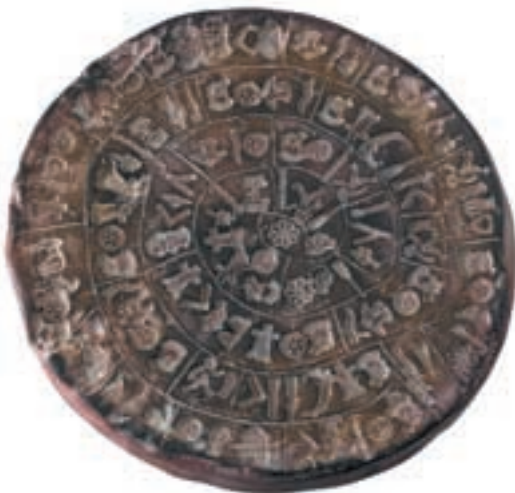
Die erste Optical Disc der Welt: Um 1700 – 1600 Jahre vor Christus. Disk aus Ton (165 mm Ø), gefunden im Palast von Phaistos/Kreta. Beide Seiten zeigen eingestempelte hieroglyphische Zeichen, die spiralförmig angeordnet sind.