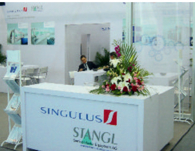
Messestand auf der Solarmesse SNEC in China

Der Umsatz im 2. Quartal 2009 lag mit 31,7 Mio. € ebenfalls unter Vorjahresniveau (Vorjahr: 51,0 Mio. €). Die prozentuale regionale Umsatzverteilung für das 2. Quartal 2009 ergibt folgendes Bild: Europa 48,7 % (Vorjahr: 46,4 %), Asien 37,4 % (Vorjahr: 32,9 %), Nord- und Südamerika 13,0 % (Vorjahr: 19,9 %) sowie Afrika und Australien 0,9 % (Vorjahr: 0,8 %). Für das 1. Halbjahr 2009 zeigt sich die prozentuale regionale Umsatzverteilung wie folgt: Europa 40,4 % (Vorjahr: 51,9 %), Asien 29,9 % (Vorjahr: 26,5 %), Nord- und Südamerika 27,5 % (Vorjahr: 20,4 %) sowie Afrika und Australien 2,2 % (Vorjahr: 1,2 %).