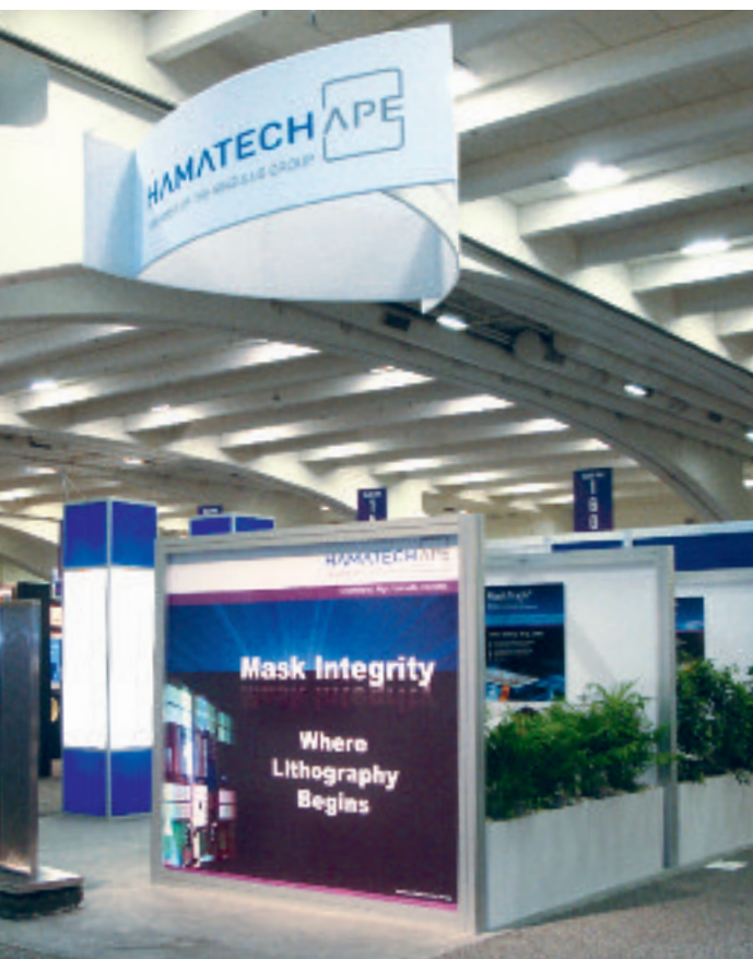
Messestand der HamaTech APE auf der Semicon West in den USA