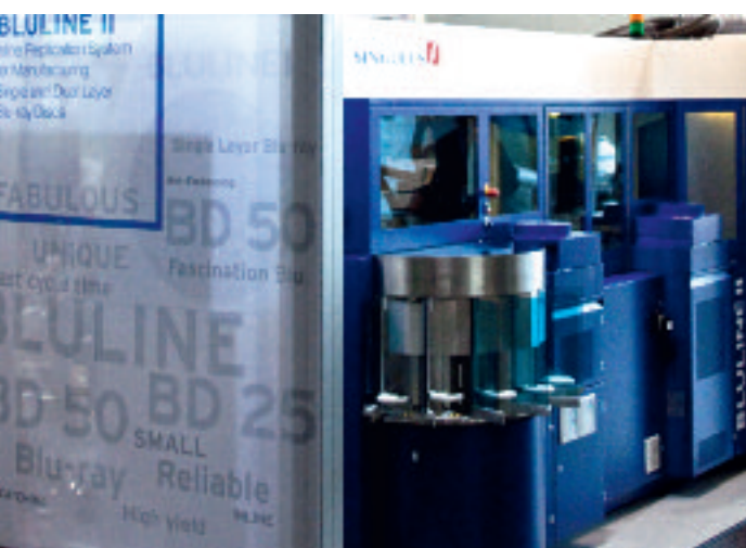
BLULINE II auf der MEDIA-TECH Europe 2009 in Frankfurt

Entsprechend der Geschäftsentwicklung lag der Umsatz der ersten sechs Monate im Jahr 2009 bei 67,1 Mio. € und damit unter Vorjahr (81,3 Mio. €). Dieser Rückgang basiert im Wesentlichen auf rückläufigen Umsatzerlösen innerhalb der Segmente Optical Disc (-20,2 Mio. €) sowie Halbleiter (-7,6 Mio. €). Das Segment Solar konnte aufgrund des guten Auftragsbestands zum Geschäftsjahresende 2008 einen Umsatzzuwachs von 13,5 Mio. € verzeichnen.