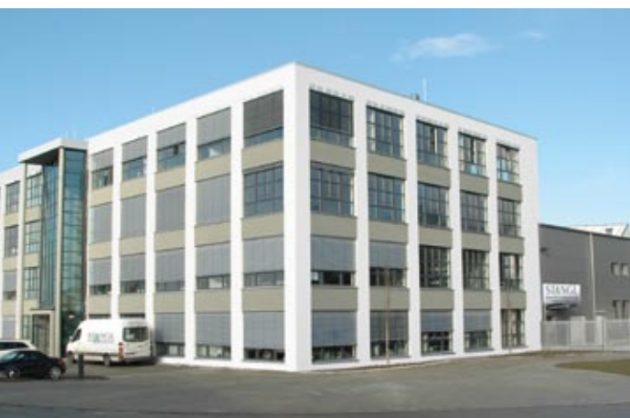
STANGL Semiconductor Equipment AG Fürstenfeldbruck, Deutschland