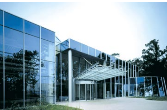
SINGULUS TECHNOLOGIES Headquarters Kahl, Deutschland