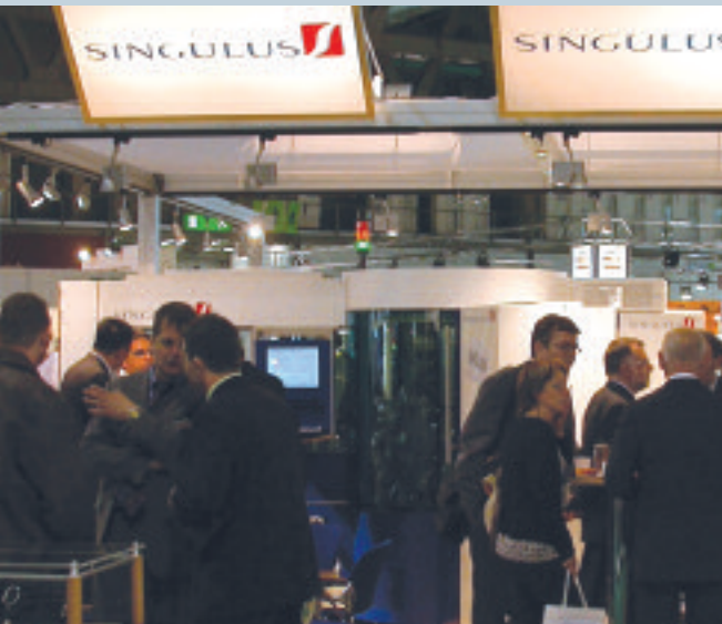
Brillen-Beschichtungsanlage OPTICUS auf der MIDO in Mailand