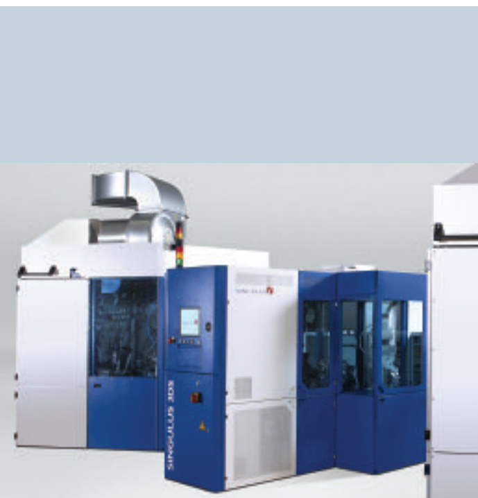
Neue Beschichtungslinie DECOLINE für Plastikteile

Unternehmen AudioDev AB, Malmö, veräußert. Es wurde ein Kaufpreis von 3,25 Mio. € erzielt. Durch den Verkauf der Anteile wird das Unternehmen mit seinen ca. 40 Mitarbeitern 2007 nicht mehr in den Konsolidierungskreis der SINGULUS Gruppe einbezogen. ETA-Optik erzielte in 2006 einen Umsatz von 4,85 Mio. €.