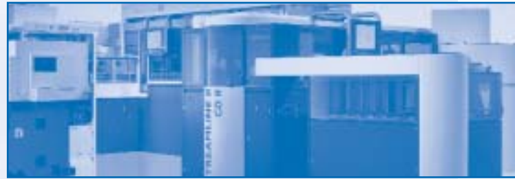
Neue STREAMLINE II Replikationslinie für CD-R

nach Europa und Asien ausgeliefert und haben den sogenannten Betatest (Vorserientest) erfolgreich bestanden. Mit der Serienproduktion der STREAMLINE II wurde bereits ab Mai dieses Jahres begonnen.