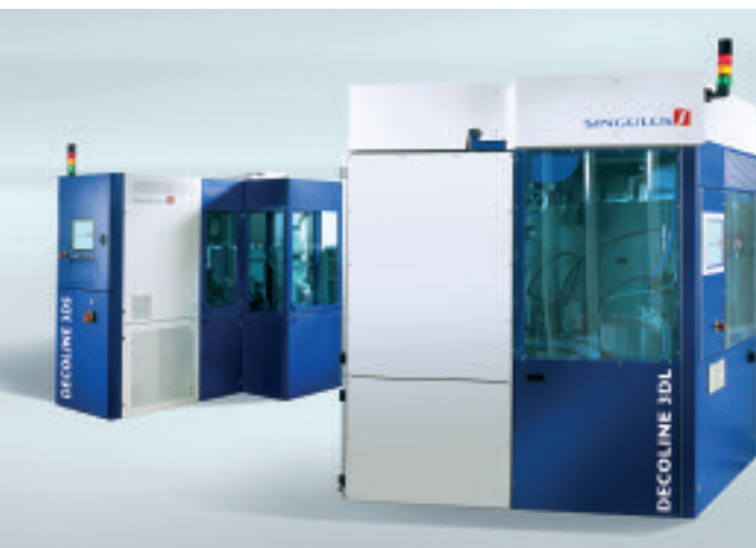
DECOLINE – Inline Beschichtungsanlage für dreidimensionale Kunststoffteile

Der Auftragsbestand per 30. Juni 2007 lag mit 77,7 Mio. € unter dem Vergleichswert 2006 von 138,7 Mio. €. Im Vorjahresvergleichswert ist ein Auftragsbestand in Höhe von 18,8 Mio. € der zwischenzeitlich entkonsolidierten Gesellschaften Manufacturing Services und ETA-Optik enthalten. Somit ergibt sich für das Vorjahr ein korrigierter Wert von 119,9 Mio. €.