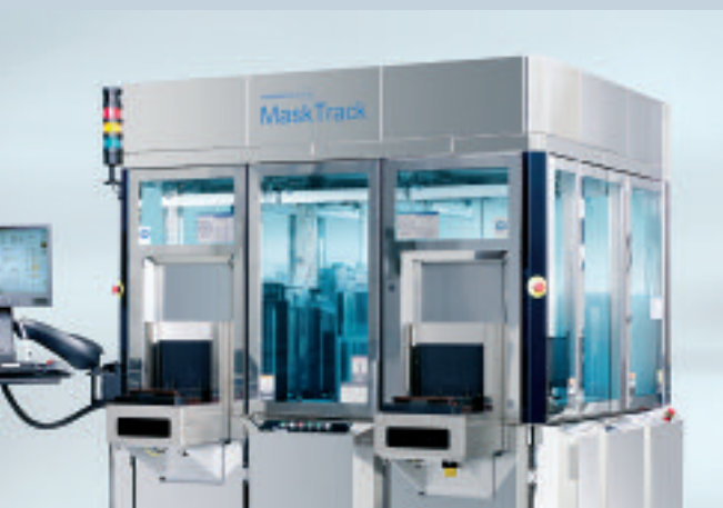
Prozessanlage zur Reinigung von Photomasken für die Halbleiterindustrie

anwesend. Danach wurde das Inline Mastering System für alle DVD, HD DVD und Blu-ray Formate auf dem Messestand gezeigt. Inzwischen wurden 2 Aufträge fest verbucht. Unterschriften für weitere Bestellungen werden kurzfristig erwartet.