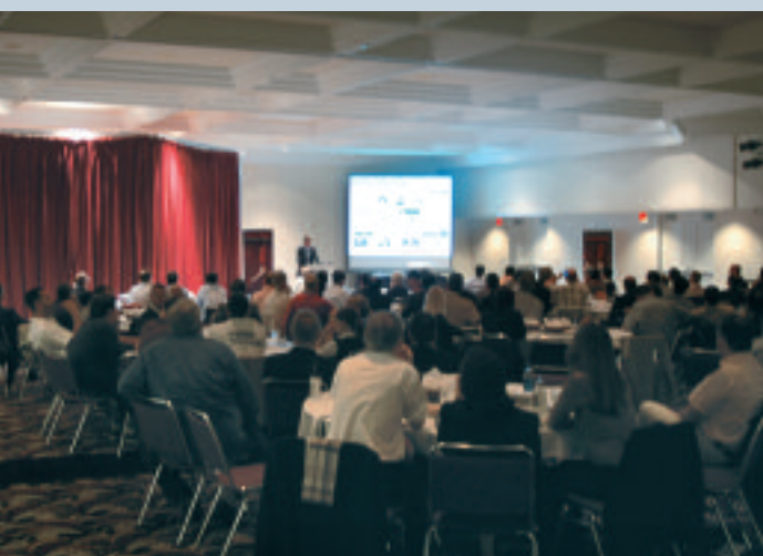
CRYSTALLINE-Präsentation in Long Beach/USA vor über 100 Besuchern