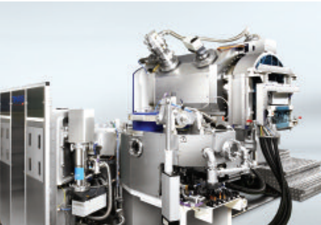
TIMARIS Beschichtungsanlage für Schreib-Lese-Köpfe und MRAM Wafer