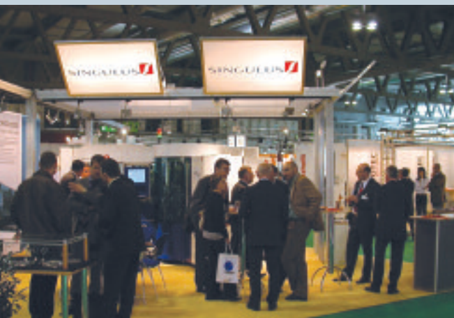
OPTICUS Brillenglas-Beschichtungsanlage auf der weltgrößten Brillenglasmesse MIDO in Mailand