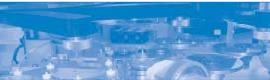
Bonding Station in einer SPACELINE SACD

geht der Vorstand nach Rücksprache mit der Deutschen Börse Frankfurt davon aus, daß unserem Antrag für die Aufnahme in das Technologiesegment des Prime Standard in vollem Umfang entsprochen wird.