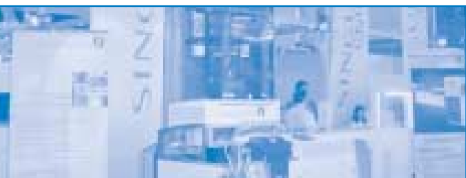
Replication Expo in Shanghai mit einer STREAMLINE DUPLEX in Betrieb