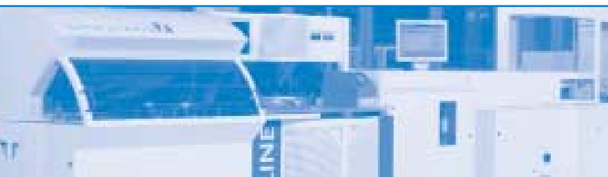
Replikationslinie STREAMLINE DVDR/SP für die Herstellung von einmal beschreibbaren DVD (DVD-R und DVD+R)