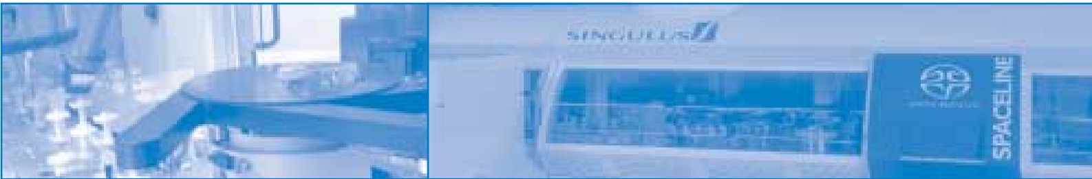
SPACELINE SACD Replikationslinie für die Herstellung der neuen Super Audio CD (links: Ausschnitt mit Ionenquelle)