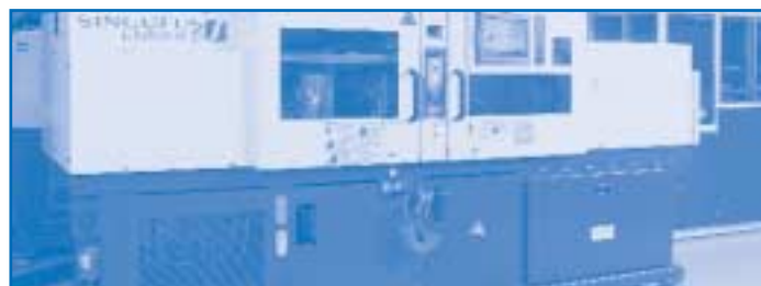
Spritzgussmaschine von SINGULUS EMOULD, Würselen