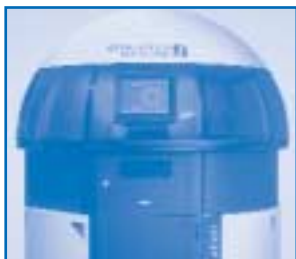
DMS-Evolution von SINGULUS MASTERING, Eindhoven, NL