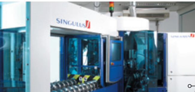
OPTICUS Installation bei Rupp+Hubrach