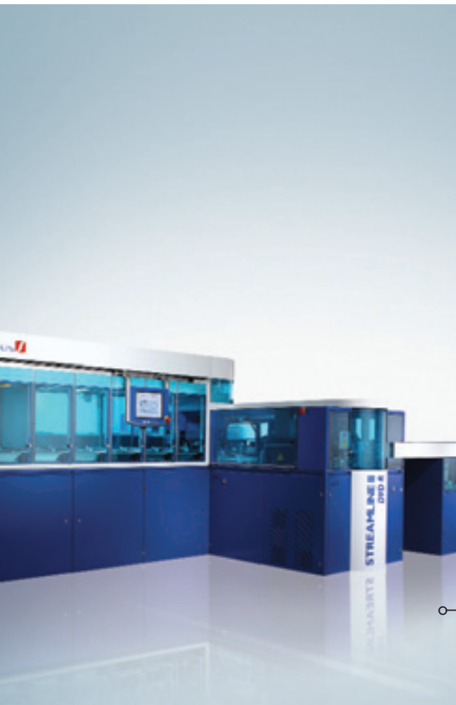
STREAMLINE II für DVDR

Im abgelaufenen Geschäftsjahr hat SINGULUS 22,8 Mio. Euro in F&E investiert. Dies entspricht einem Zuwachs von 39,8 % gegenüber 2003. Die Schwerpunkte der F&E Aufwendungen im Kerngeschäft Optical Disc lagen in den Bereichen SPACELINE II und STREAMLINE II, in der Weiterentwicklung der Spritzgusstechnik sowie in der Optimierung und Neuentwicklung von Mastering-Systemen.