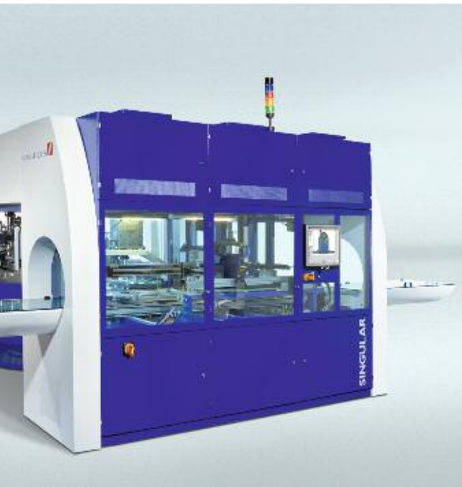
SINGULAR – Neue Produktionsanlage zur Herstellung von Silizium-Solarzellen

verschiedenen nasschemischen Prozessen für Silizium- und Dünnschicht-Solarzellen verfügt SINGULUS über die notwendige Expertise bei Vakuum-Beschichtungstechnologien und in der Automatisierung, um komplexe Maschinen für neuartige Zellkonzepte zu entwickeln und kostengünstig zu fertigen. Im Geschäftsjahr 2008 wurde bei SINGULUS eine Maschine zum Beschichten von Silizium-Solarzellen entwickelt. Diese Maschine mit dem Produktnamen SINGULAR wird im Verlauf des Geschäftsjahres 2009 in den Markt eingeführt. Es ist geplant, in den kommenden Jahren weitere Prozessschritte bei der Herstellung von Solarzellen durch von uns neu entwickelte Maschinen abzudecken und so die Wertschöpfung für unser Unternehmen im Solarbereich zu erweitern.