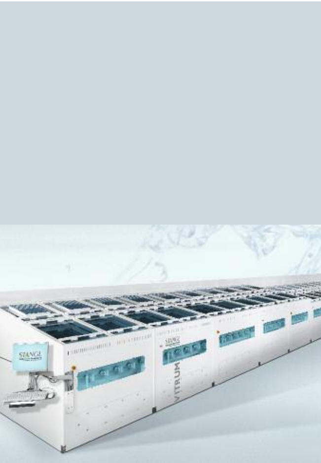
VITRUM - Nasschemische Reinigungs- und Beschichtungsanlage von STANGL für Dünnschicht-Solarglas

In der Berichtsperiode betrug der Mittelzufluss aus der Finanzierungstätigkeit 23,5 Mio. € (Vorjahr: 1,2 Mio. €). Der positive Cashflow aus der Finanzierungstätigkeit resultiert im Wesentlichen aus der Inanspruchnahme von Darlehen in Höhe von 35,0 Mio. € im Zusammenhang mit der Finanzierung der Zahlung der Barkomponente für den Erwerb von 51 % der Anteile an der STANGL Semiconductor Equipment AG. Weiterhin wurden durch die Veräußerung einer Steuerforderung Einzahlungen in Höhe von 8,9 Mio. € erzielt. Gegenläufig wurden im Geschäftsjahr 2008 Bankverbindlichkeiten in Höhe von 20,2 Mio. € zurückgeführt. Im Ergebnis erhöhten sich die liquiden Mittel im Berichtsjahr um 3,1 Mio. €.