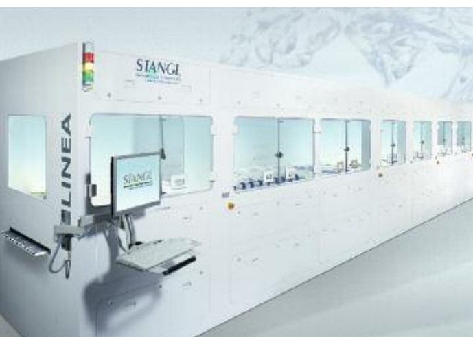
LINEA – Neue Inline Reinigungsanlage für Silizium-Solarzellen

Im Berichtsjahr war der Cashflow aus der betrieblichen Geschäftstätigkeit in Höhe von -11,2 Mio. € negativ. In der Vorjahresvergleichsperiode war der operative Cashflow mit -3,6 Mio. € negativ. Die Mittelabflüsse aus der Investitionstätigkeit belaufen sich auf 9,1 Mio. € gegenüber 16,7 Mio. € im Vorjahresvergleichszeitraum. Diese resultieren im Wesentlichen aus Auszahlungen im Zusammenhang mit dem Erwerb der Blu-ray Aktivitäten von der Oerlikon Balzers AG. Darüber hinaus wurden 2008 weitere Anteile an der HamaTech AG zu einem Kaufpreis in Höhe von 2,1 Mio. € erworben.