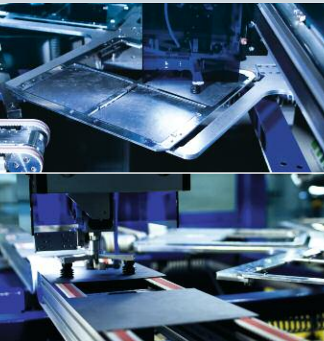
Innenansichten der SINGULAR Produktionsanlage zur Herstellung von Silizium-Solarzellen

Das Ergebnis vor Zinsen und Steuern (EBIT) ist im Berichtsjahr mit -46,2 Mio. € negativ (Vorjahr: 1,1 Mio. €). Bereinigt um Restrukturierungskosten und Impairmentaufwendungen ergibt sich ein positives EBIT in Höhe von 2,0 Mio. € (Vorjahr: 4,2 Mio. €). Im Einzelnen war das operative Ergebnis des Segments Optical Disc einschließlich Restrukturierungsaufwendungen in Höhe von 26,2 Mio. € mit