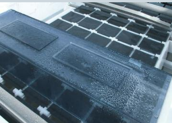
Innenansicht LINEA mit Transporteinrichtung für jeweils 5 Silizium-Solarzellen